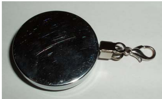
Detta är Keepern