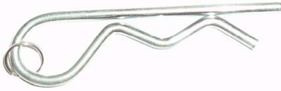
Med denna sitter plånboken fast i keepern