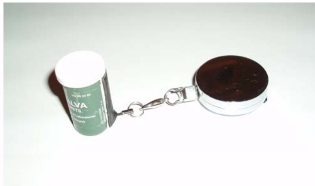
Så sitter din grej fast i Keepern