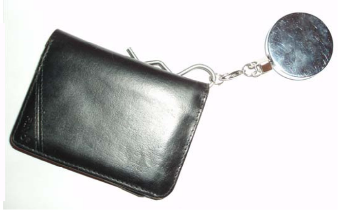
Så sitter din grej fast i Keepern