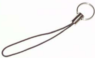
Med denna sitter telefonen fast i keepern