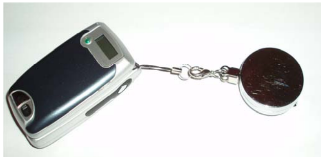
Så sitter din grej fast i Keepern