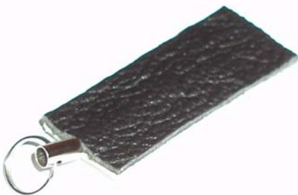
Med denna sitter serattet fast i keepern