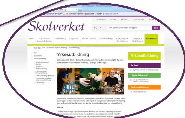
Stöd för strategisk apl-utveckling