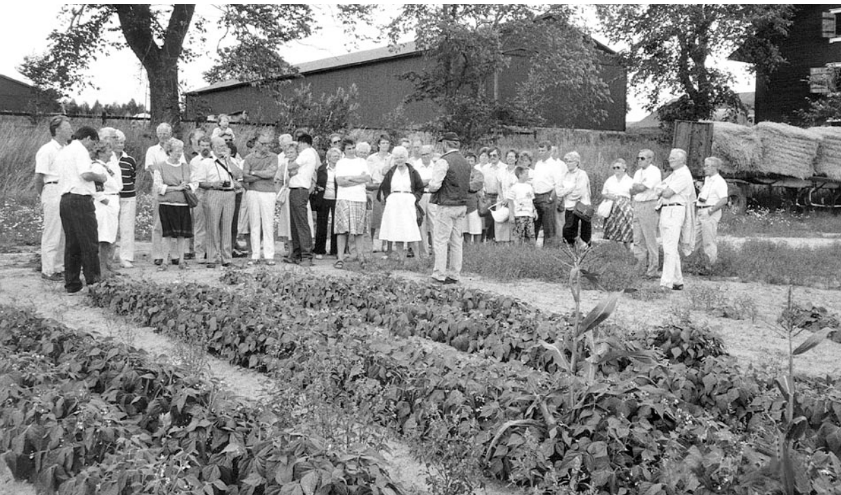
Sommarmötet 1989. Finstas köksväxtodling demonstreras.