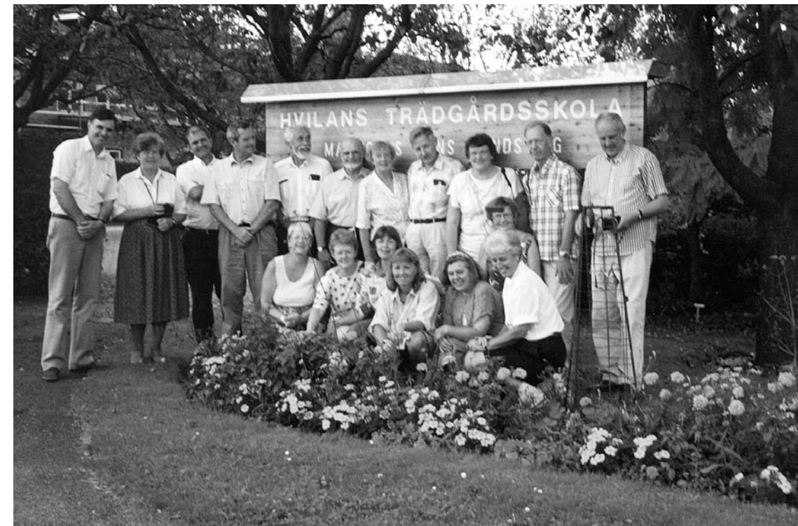
Sommarmötet på Hvilans trädgårdsskola 1995.